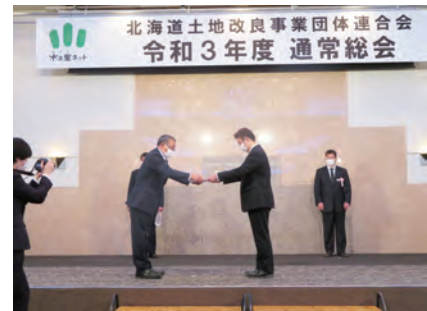
優良職員の代表で受賞

優良職員は土地改良事関係団体の職員として20年以上職務に精励勤続し、成績が特に優良で他の職員の模範となる方に贈られるものです。