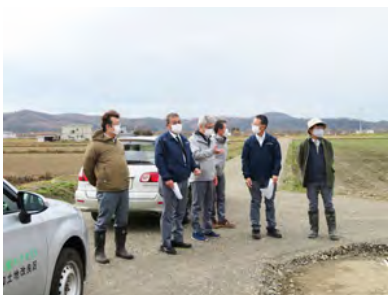
監事による現地監査 (11/9)