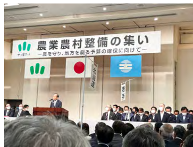
農業農村整備の集い (6/14)